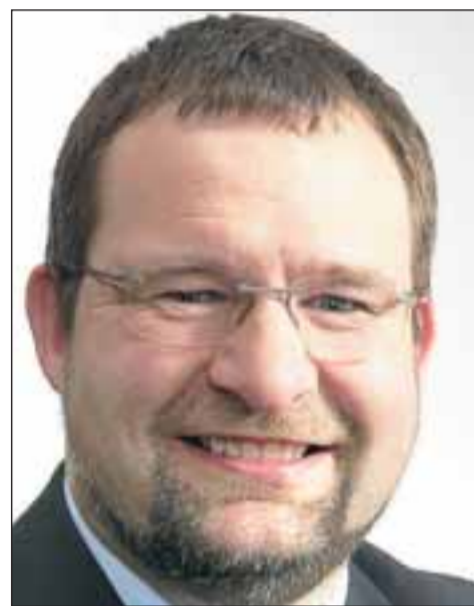
Er will in Pforzheim das Ruder herumreißen: OB Gert Hager.

wäre falsch, mit der Geldschere im Kopf zu denken.“ Über alle Ergebnisse werden die Pforzheimer im Internet – auf der städtischen Homepage, Twitter und Facebook – informiert. „Wir funken auf allen Kanälen“, sagt Hager. Das letzte Wort hat der Gemeinderat, der sich bis dahin „freiwillig zurückhält“ (Hager).