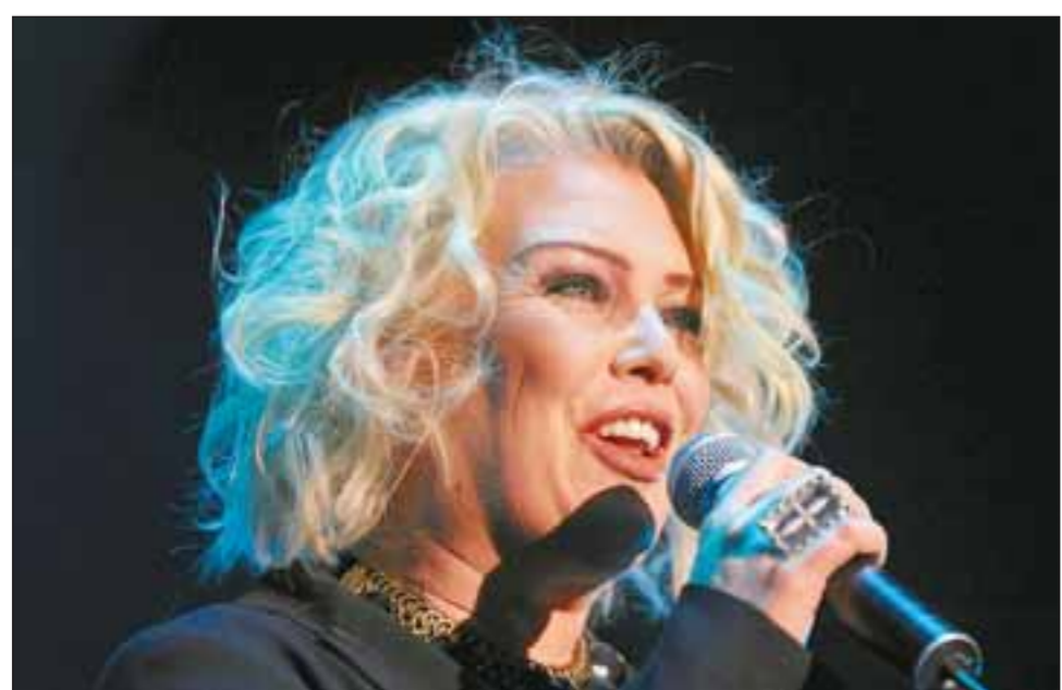
Sie will es noch einmal wissen: Kim Wilde, Rock-Star der 80er Jahre, ist wieder unterwegs und gab ein Konzert im Mannheimer Rosengarten.

Das Unverwechselbare ihrer Stimme hat sie über die Jahrzehnte nicht nur retten können. Für Kim Wilde gilt Ähnliches wie für Tina Turner: Je oller, desto doller!