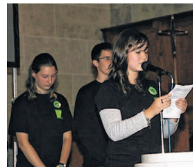
Von Jugendlichen für Jugendliche: Das galt auch im Eröffnungsgottesdienst.