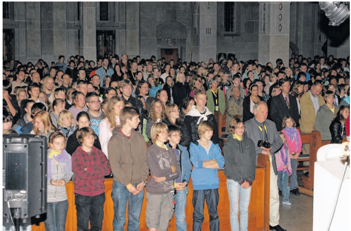
Vorsichtshalber vom Marktplatz in die katholische Kirche St. Georg verlegt: Der Eröffnungsgottesdienst stimmte die „Youvent“-Teilnehmer auf das ereignisreiche Wochenende ein, bevor es zu verschiedenen anderen Orten weiterging.

Die restlichen Programmpunkte im Freien sollen aber wie geplant stattfinden und neben den Gottesdiensten und Andachten auch Einheimische anlocken. „Wir hoffen noch auf viele Tagesgäste. Ich kann mir gut vorstellen, dass der eine oder andere zum Abschlussgottesdienst aus der näheren Umgebung vorbeischaut“,