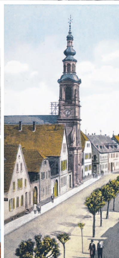
Stadtkirche, Lutherhaus und Kleine Planken bilden eine Einheit (oben). Um 1900 stand die Fassade in einer Front mit den Bürgerhäusern (rechts unten). Die weiteren Bilder zeigen die Grundsteinlegung zur Erweiterung der Kirche 1912, den Zug mit den Glocken durch die Stadt 1951, den ausgemalten Altarraum 1948, den Bittbrief an Kurfürst Carl Theodor und das Kircheninnere 2010.