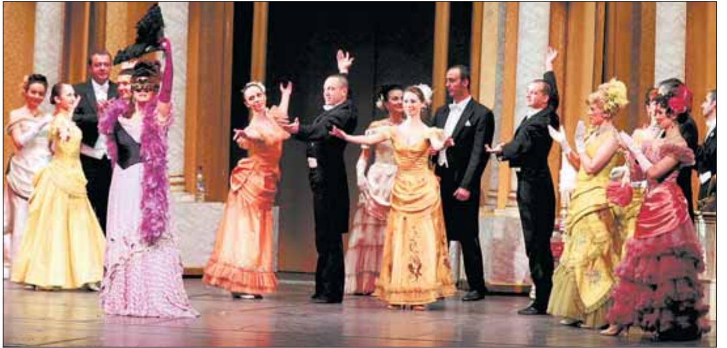
Die bestens aufgelegten Akteure der Operettenbühne Wien präsentierten im Palatin „Die Fledermaus“ von Johann Strauß und begeisterten ihr Publikum mit hinreißendem Gesang und jeder Menge komödiantischem Talent.