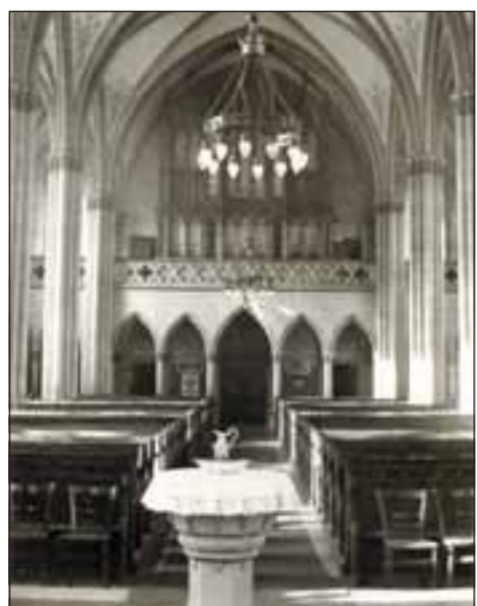
Seit 1950, als dieses Bild entstand, wurde der Innenraum der evangelischen Kirche Walldorf zwei Mal neu gestaltet.

Oder das Bild des gekreuzigten Christus hinter dem Altar, das, wie Pfarrer Löffler einräumte, manchen Kindern Unbehagen bereitet. Doch der Schädel unter dem Kreuz stehe eigentlich für die Überwindung des Todes, so Löffler, und daher für die Hoffnung, die Jesus verkörpert, ebenso wie die Sonne, die hinter dem Kreuz erstrahlt. Das Bild ist ein historisches Stück, ein unbekanntes Gemein-